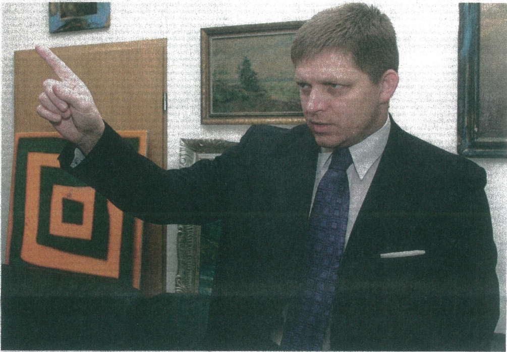
V roku 2003 sa Robert Fico angažoval v politike i v biznise. Po roku však svoj podiel vo firme R.F. Development predal a s podnikaním skončil.